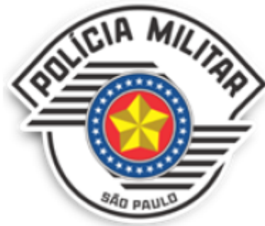
FIGURA Nº2 - MODELO DA LOGOMARCA