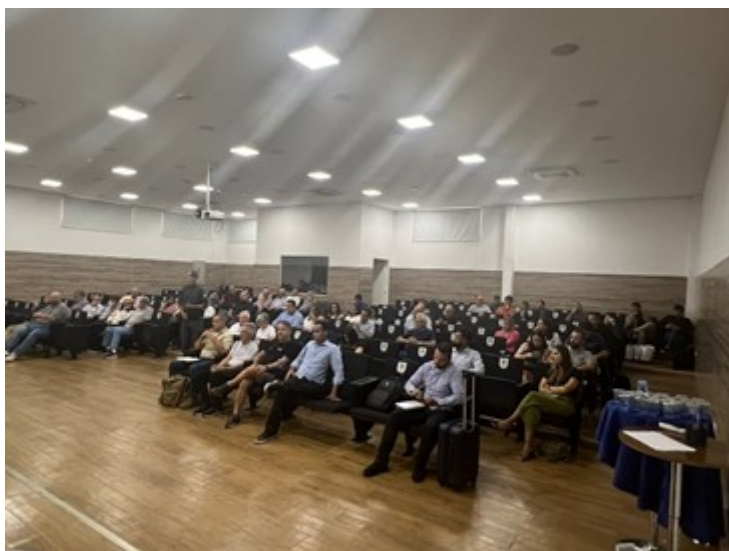
Audiência Pública – 17/01/2024.

escolha da solução a contratar, é possível considerar contratações similares feitas por outros órgãos e entidades públicas, bem como por organizações privadas, no contexto nacional ou internacional, com objetivo de identificar a existência de novas metodologias, tecnologias ou inovações que melhor atendam às necessidades da Administração.